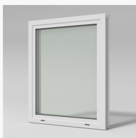
LFI1003 LFI1003 Haga fastkarm inv. glasn. 3-glas