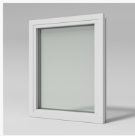
LFI1003 LFI1003 Haga fastkarm inv. glasn. 3-glas