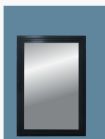
LKF681 LKF681 Ving kipp-drehfönster 2+1