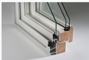
LKF681 LKF681 Ving kipp-drehfönster 2+1