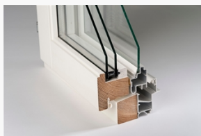
LKF681 LKF681 Ving kipp-drehfönster 2+1