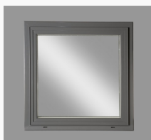
LKF681 LKF681 Ving kipp-drehfönster 2+1