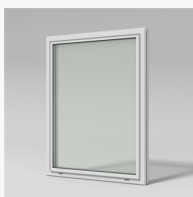
LFI853 LFI853 Ving fastkarm inv. glas. 3-glas