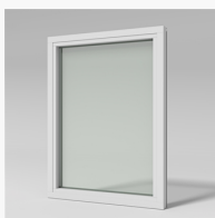
LFI853 LFI853 Ving fastkarm inv. glas. 3-glas