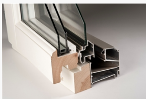
LKF1101 LKF1101 Epok kipp-drehfönster 2+1