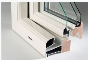
LKF1101 LKF1101 Epok kipp-drehfönster 2+1