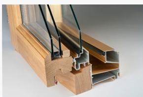
LKF1101 LKF1101 Epok kipp-drehfönster 2+1 med ek