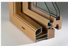
LKF1101 LKF1101 Epok kipp-drehfönster 2+1 med ek