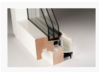
LKF783 LKF783 Standard kipp-drehfönster 3-glas