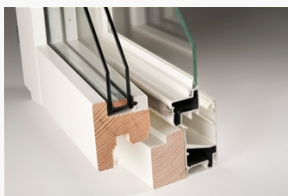
LKF781 LKF781 Standard kipp-drehfönster 2+1