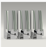
Ytterbåge En jämförelse mellan de tre ytterbågsprofilerna Standard, Epok och Ving