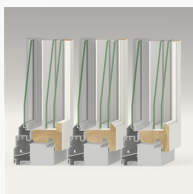
Innerbåge De olika innerbågarna Standard, Haga och Ving