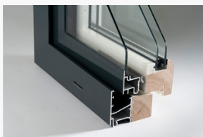
LKF781YIE LKF781YIE med epokinnerbåge