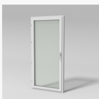
LID1001YE LID1001YE Haga inåtg. fönsterdörr 2+1 helglasad