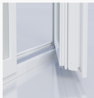
Närbild på tröskel

LID1001, inåtgående fönsterdörr 2+1-glas