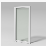
LID1001YE LID1001YE Haga inåtg. fönsterdörr 2+1 helglasad