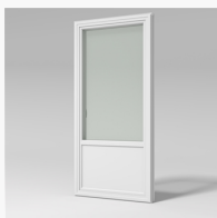
LID1001YE LID1001YE Haga inåtg. fönsterdörr 2+1 med fyllning