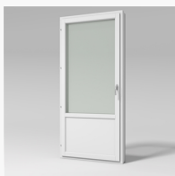
LID1001YE LID1001YE Haga inåtg. fönsterdörr 2+1 med fyllning