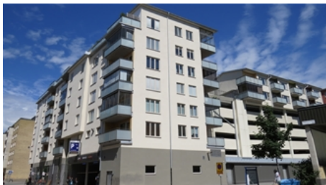
Projektnamn BRF. Järnvägsparken