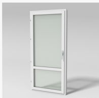
Med post LID831 Haga inåtg. fönsterdörr 2+1 med post