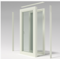
Dubbelkarm utsida Dubbelkarm utsida